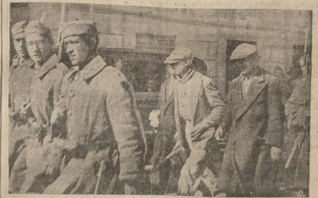
Ölüm saatini bekleyenlerden ikisi divaniharbe götürülüyor

Atina Divaniharbinin Bugün Birçok İdam Hükümü Vermesi Bekleniyor